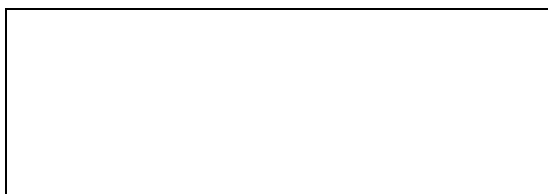
Схема границы балансовой принадлежности тепловых сетей

Прочие сведения по установлению границ раздела балансовой принадлежности тепловых сетей _____